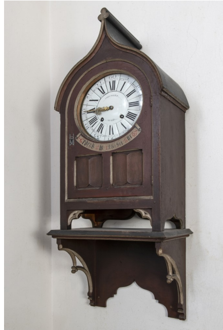
Wandklok in neogotisch stijl, omstreeks 1860, maar met een mechanisme uit de jaren 1750 (Ferdinand Cheval(l)ier uit Parijs).

houden (zowel gerechten als borden) of er konden strijkbouten (strijkijzers) op verwarmd worden.