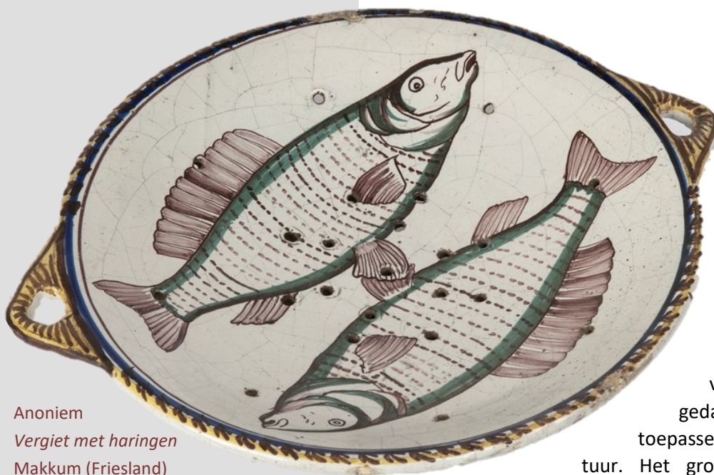
Anoniem Vergiet met haringen Makkum (Friesland) 1750-1800

het Minnewater. Twee schilderijen met als onderwerp een stilleven prijken aan de muren. Het ene werk, Stilleven met bloemen en groenten in een landschap , is van de hand van Michel Bouillon (ca. 1616— in/na 1674) en te situeren in de 17 de eeuw. Het andere, Stilleven met haring, ajuinen en wijn , is van Pieter Claesz (1597/8-1661) en gedateerd 1646. Beide werken zijn heel toepasselijke onderwerpen voor de eetcultuur. Het grote schilderij De Ark van Noach (omstreeks 1620-1640) is toegeschreven aan Hans III Jordaens (1590-1643). Die drie werken hingen nooit in de keuken toen die als dusdanig in gebruik was. Ze zijn er pas gekomen rond 1975 toen het kasteel opengesteld werd voor een breed publiek.