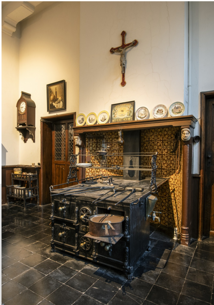
Het fornuis in de neogotische schouw (met de rechtstanden versierd met 'middeleeuwse' hoofden), het kloppend hart van de keuken. Links de wandklok en de deur naar de diensttrap.

niet in de kelders te voorzien, maar op het gelijkvloers. In die jaren was het immers nog heel gebruikelijk om in kastelen en herenhuizen de keuken weg te steken onder de grond omwille van lawaai, geurhinder, circulatie en brandrisico, maar ook om te vermijden dat meesters en personeel elkaar constant zouden kruisen. Er dienden dan allerhande hulpmiddeltjes te worden gezocht om het eten warm op te dienen: de vrouw des huizes behielp zich met een tafelbel om de dienstmeid te laten weten dat ze de volgende schotel mocht opdienen. Of er kon ook gebruik worden gemaakt van een chauffe-plat geïntegreerd in een gietijzeren radiator zodat de schotels warm op tafel kwamen zoals in Brugge in de Langestraat 21 werd gedaan. De kasteelvrouw van Loppem wilde de keuken dicht bij de eetkamer voorzien. Toch werd die enerzijds gescheiden door de dienstgang met de rest van de vertrekken en anderzijds met de diensttrap van l'office ten opzichte van de eetkamer. Eigenlijk zijn er twee keukens in het kasteel: de 'natte keuken' en de 'warme keuken'. In de 'natte keuken' bevindt zich de spoelbak waar groenten en fruit konden worden gewassen of de vaat kon worden ge-